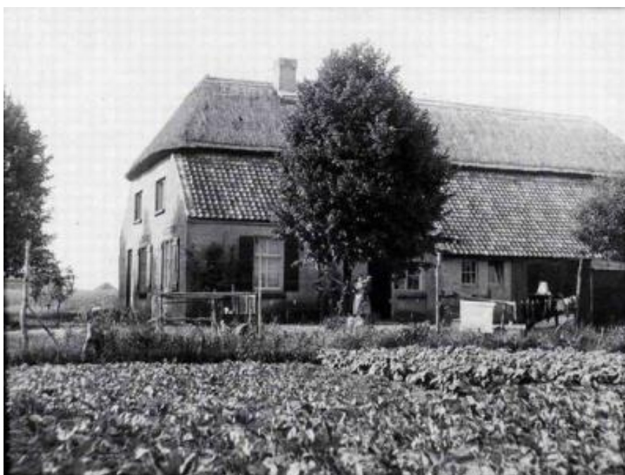
De Rosinahoeve in 1937