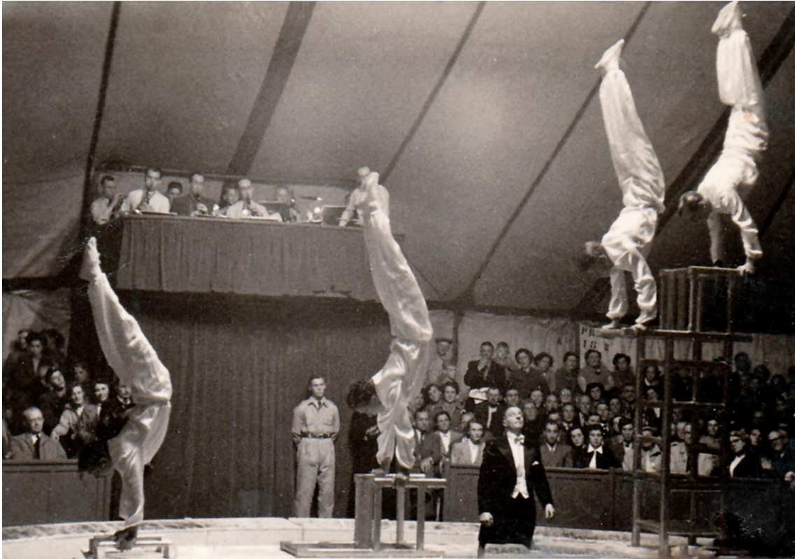
Circus 't Hoefke rond 1950: de Stoelino's met acrobaten van KDO