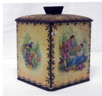
Thee voorraadbusje (collectie Oudheidkamer)