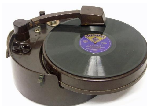
Pickup de hoedendoos (collectie Beeld en Geluid)