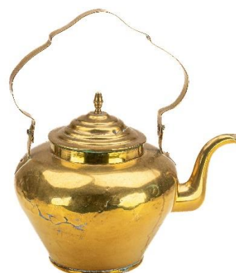
Koperen ketel (Collectie Oudheidkamer)