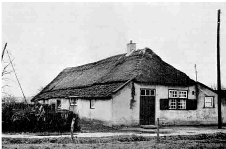
't Derp, boerderij 1920 (collectie Beeld en Geluid)