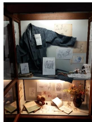
werk uit de laatste levensfase