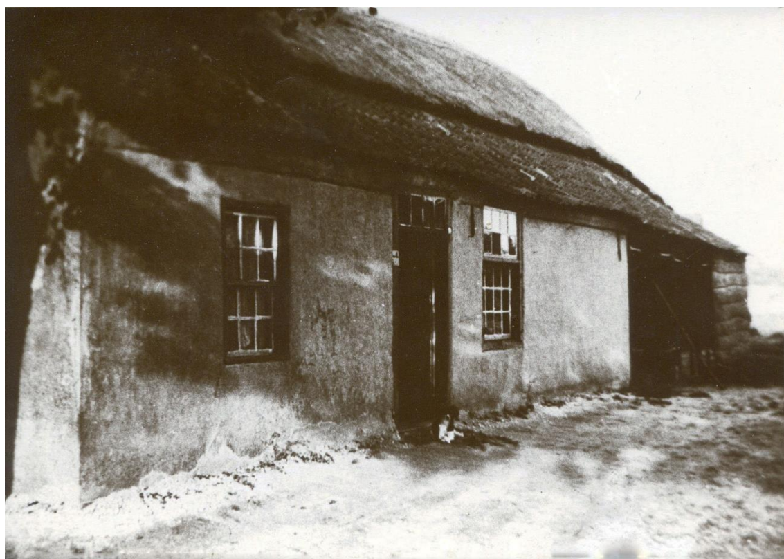
Boerderij aan de Kievitweg