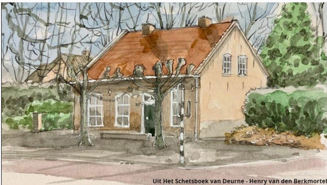
Uit Het Schetsboek van Deurne - Henry van den Berkmortel