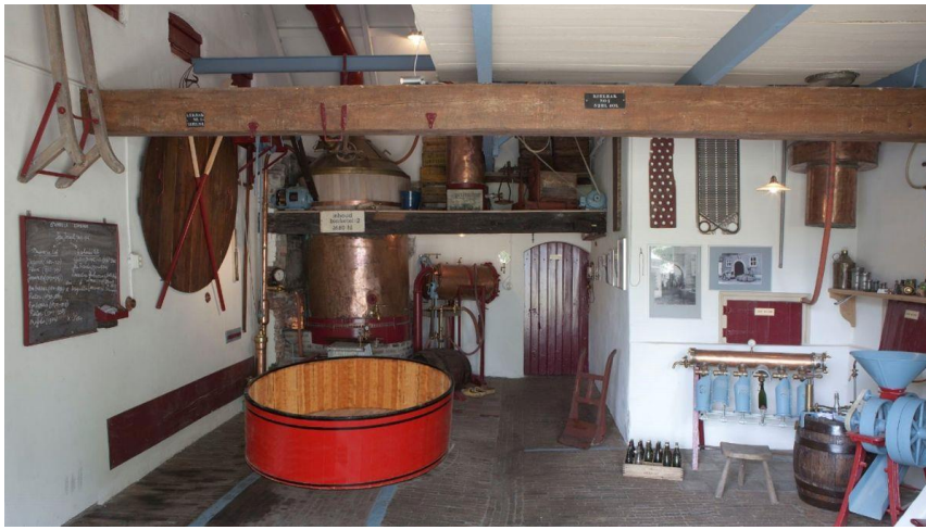
Brouwerij de Zon: binnenaanzicht met roerbak.