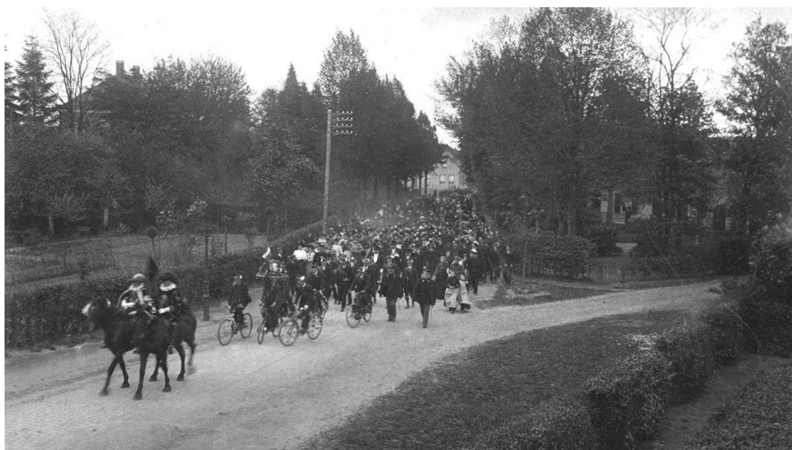
Stationsstraat met 100 jaar bevrijding (toen van de Fransen) in 1913. Op de achtergrond is het toen nog pas nieuwe heemhuis te zien. Het paadje rechts is de huidige Pastoor Jacobsstraat. De telefoonpaal centraal heeft 16 isolatoren wat waarschijnlijk duidt op net zoveel aansluitingen toen. Verder zien we heel veel Deurnenaren.