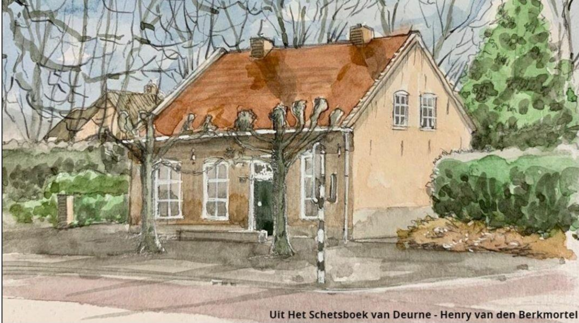
Uit Het Schetsboek van Deurne - Henry van den Berkmortel