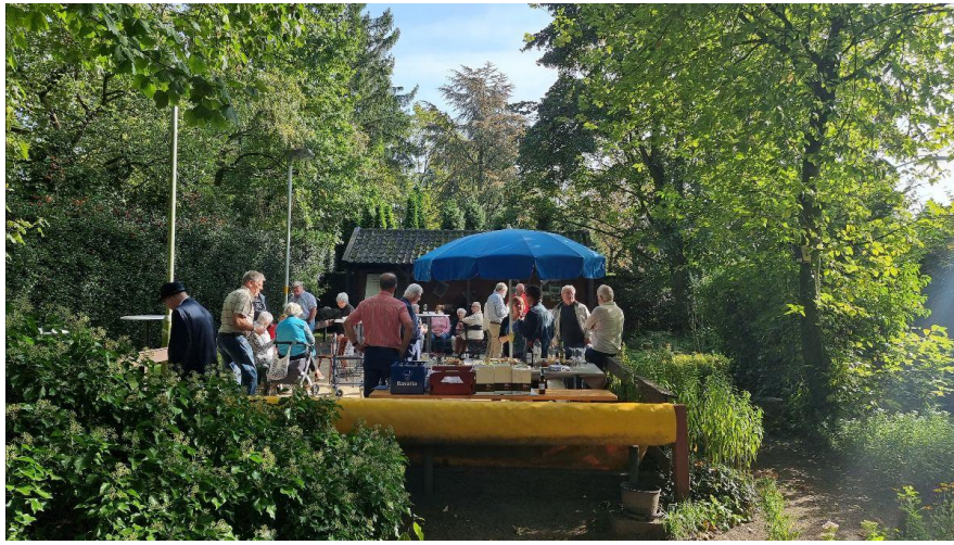
De vrijwilligersmiddag in de heemtuin