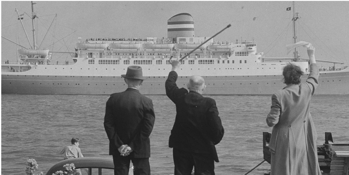
Immigranten worden uitgezwaaid