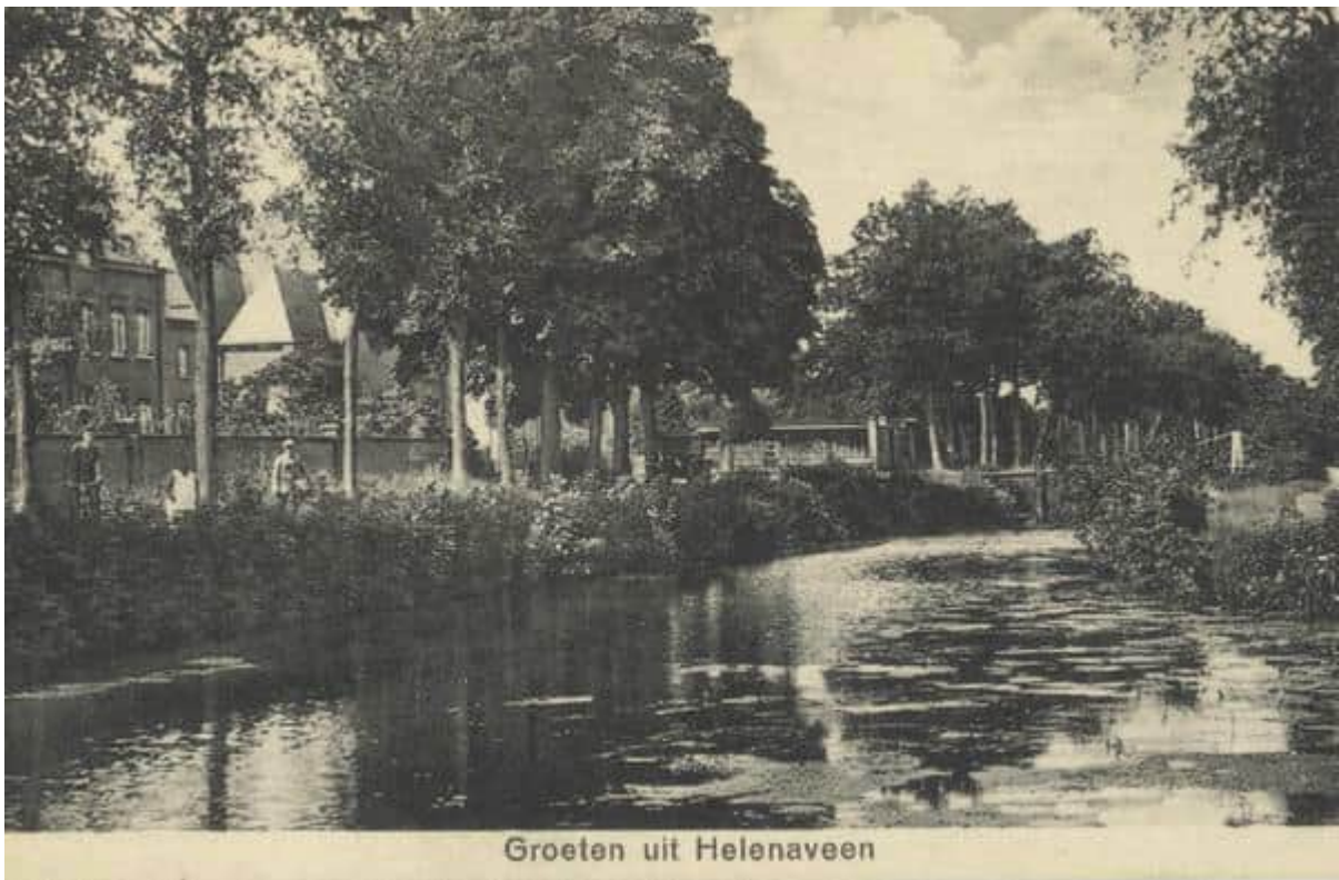
Collectie Beeld en Geluid