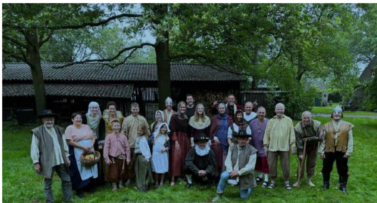
De acteurs in de film 'Terug naar het Klein en Groot Kasteel'