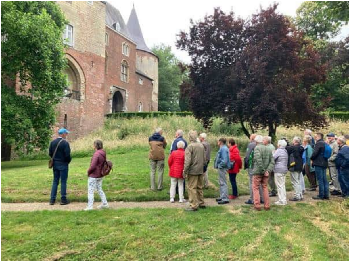
Deelnemers aan de excursie bij het kasteel van Horn