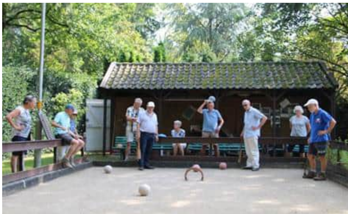
Demonstratie beugelen tijdens de Open Monumentendag