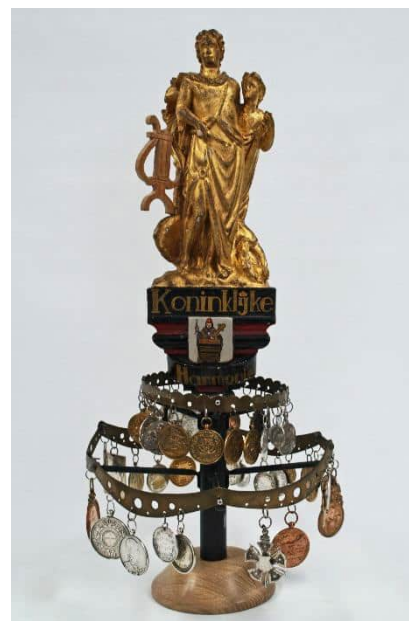
Menneke van de Harmonie