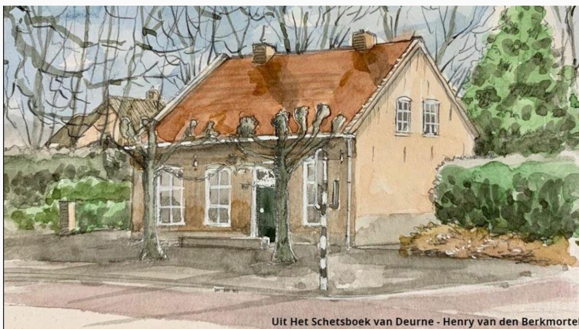
Uit Het Schetsboek van Deurne - Henry van den Berkmortel