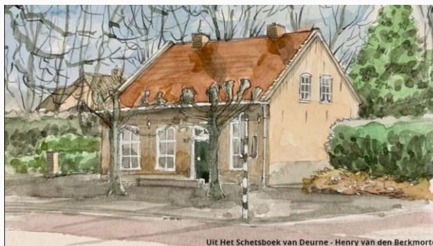
Uit Het Schetsboek van Deurne - Henry van den Berkmortel