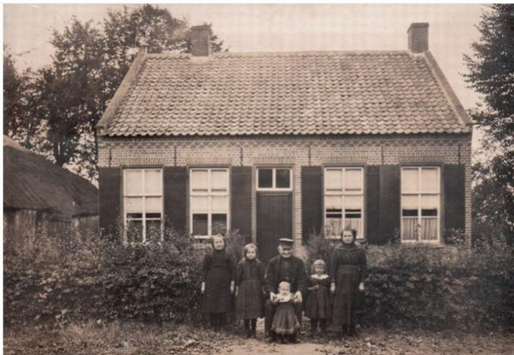
Opa met kleinkinderen. Voor zijn huisje poseert een trotse opa met zijn kleinkinderen. Waar dit huisje staat / stond is niet bekend. Ook willen we graag weten wie de personen zijn en wanneer deze foto is gemaakt.