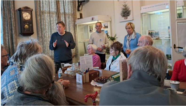
Opening tentoonstelling 'Aandacht voor bomen' in het heemhuis