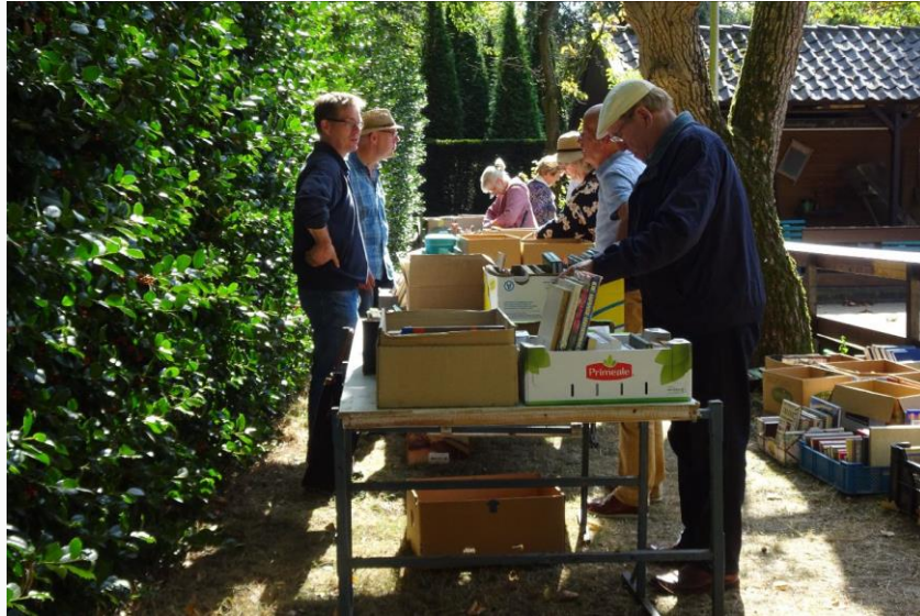
De boekenbeurs in de tuin van het Heemhuis - 2023