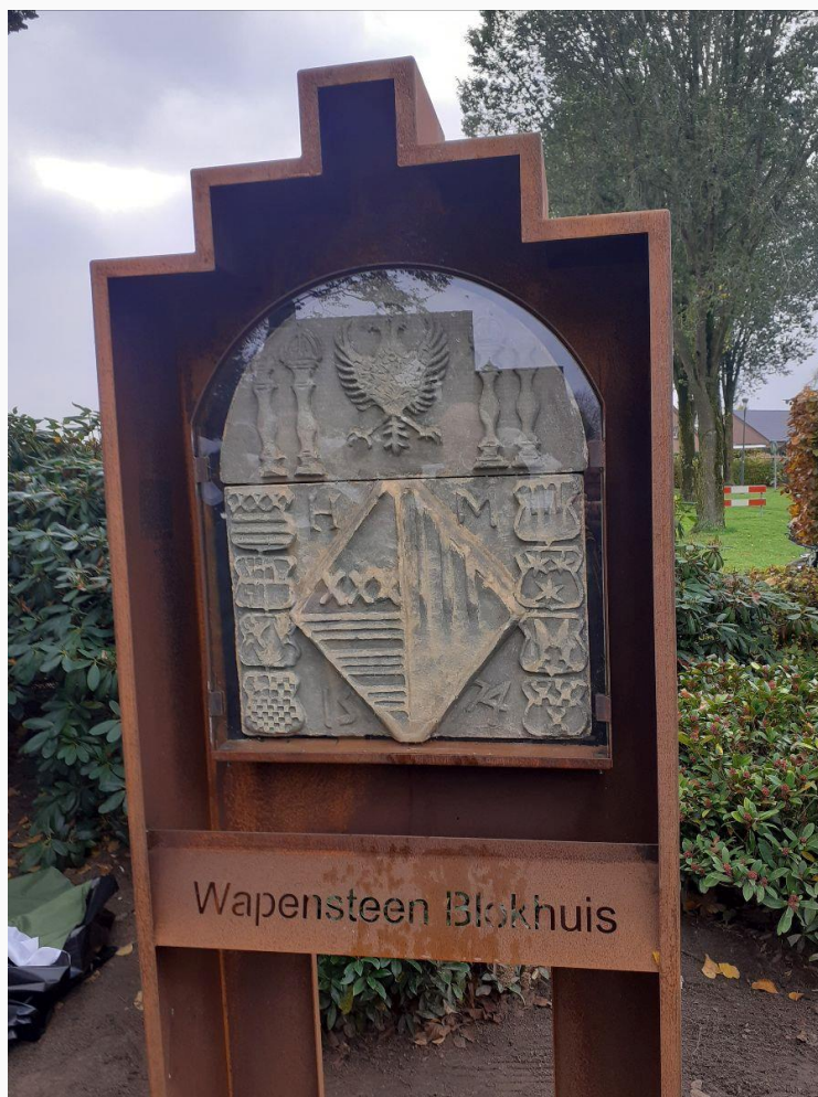
Wapenstein bij de Hubertuskapel in Liessel