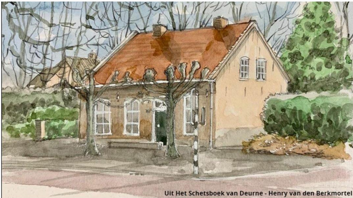
Uit Het Schetsboek van Deurne - Henry van den Berkmortel