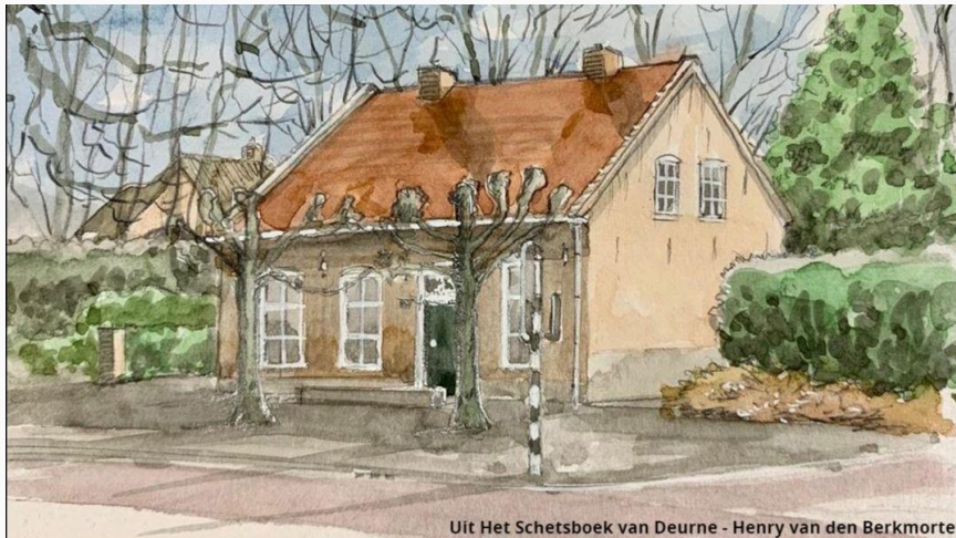
Uit Het Schetsboek van Deurne - Henry van den Berkmortel