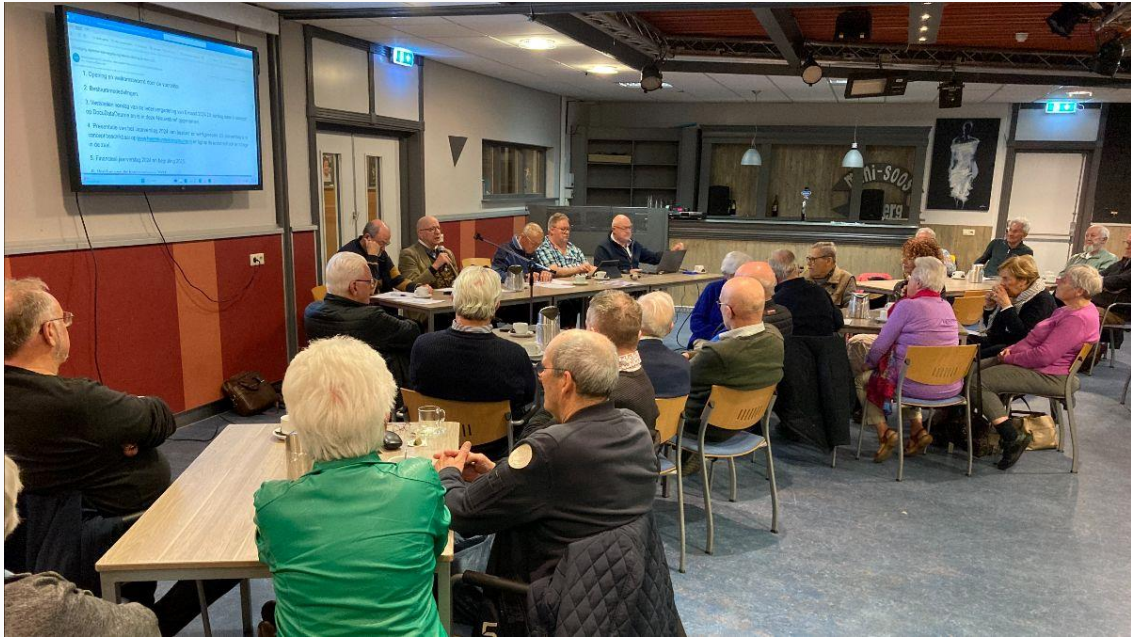
Impressie Algemene Ledenvergadering 26 maart 2025