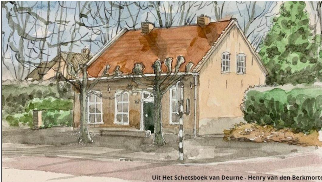
Uit Het Schetsboek van Deurne - Henry van den Berkmore