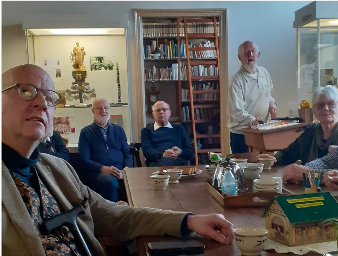
Impressie van de opening

Nieuwsgierig geworden? Kom kijken en luisteren naar de presentatie.