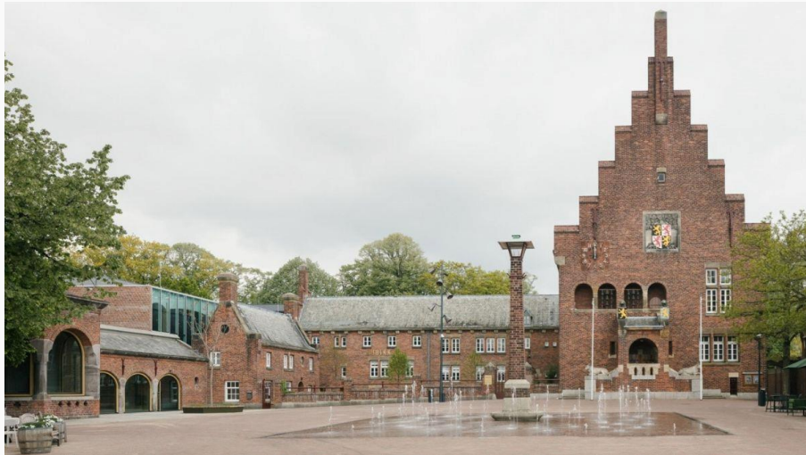
Museum Schoenenkwartier Waalwijk

De tentoonstelling is tot en met 8 juni 2025 tijdens de reguliere openingstijden van het heemhuis te bezichtigen.