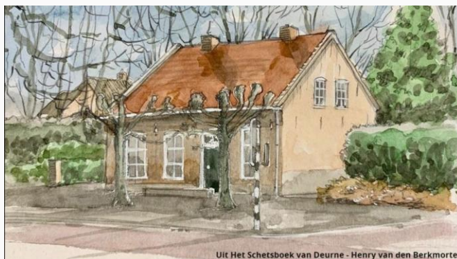
Uit Het Schetsboek van Deurne - Henry van den Berkmortel